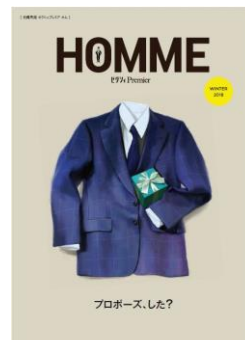
付録①:ティファニーブルーがあしらわれているオリジナル婚姻届